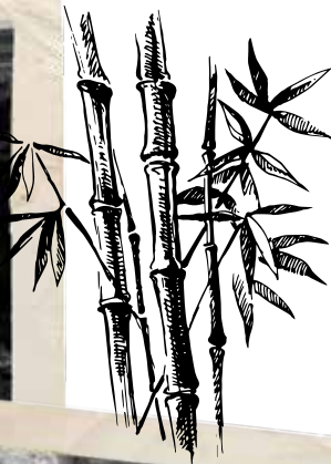
Vänster. Skyltfönster till butiken Indiska utställningen.